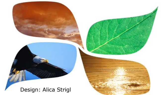
Design: Alica Strigl

Kommunikation, die kooperatives Verhalten fördert